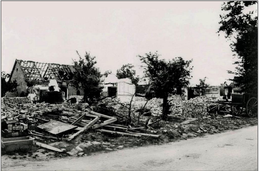
Gebombardeerde huizen in de Dorpsstraat van Gendt

Het Exoduscomité streeft ernaar aandacht te vragen voor de bijzondere en kwetsbare positie van burgers in oorlogstijd. Dit leidde tot de realisatie van enige Exodusmonumenten in de regio die een tastbare herinnering vormen aan de grote evacuatie in de laatste periode van WO II.